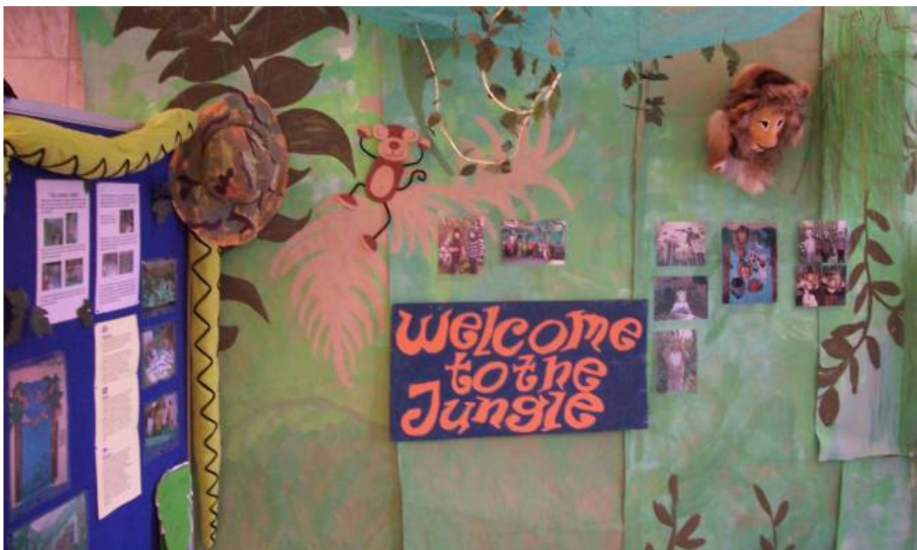
„Jacob’s Kindergarten: ”The jungle theme”. Utställning på barn- och ungdomsavdelningen i juli 2008