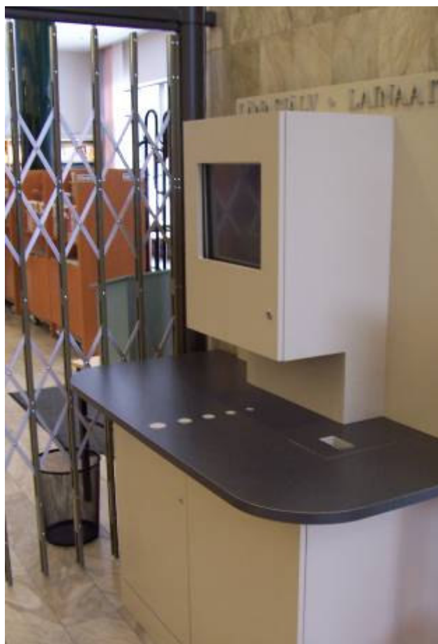
Bibliotekets utlåningsautomat togs i bruk i januari

Det har blivit allt vanligare att man använder olika VoIP-tjänster för att telefonera. Nu fungerar det här också på vårt bibliotek, då vi sedan hösten 2008 har en dator som är försedd med headset och som har Skype förinstallerat.