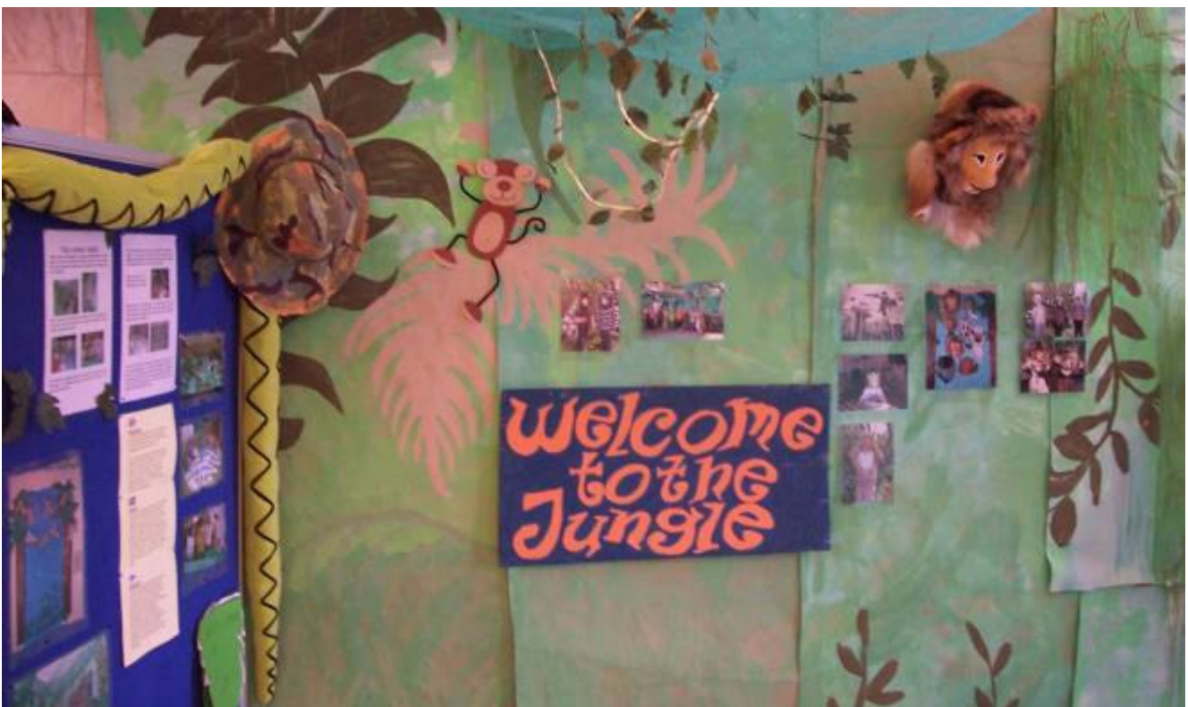
Jacob's Kindergarten: "The jungle theme". Näyttely lasten- ja nuortenosastolla heinäkuussa 2008