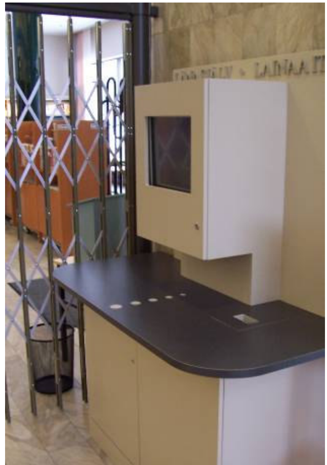
Kirjaston lainausautomaatti otettiin käyttöön tammikuussa.

Erilaisten VoIP-palvelujen käyttäminen puheluihin on yleistynyt. Nykyisin ne toimivat myös meidän kirjastossamme, kun täällä on syksystä 2008 lähtien ollut yksi kuulokkeilla varustettu tietokone, johon on asennettu Skype.